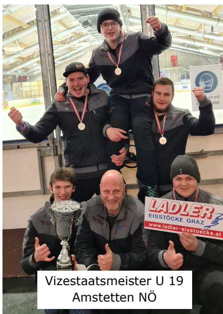
Vizestaatsmeister U 19 Amstetten NÖ

Nach beinahe 2 Jahren pandemiebedingter Pause auch im Eis- und Stocksport, konnten zumindest in dieser Wintersaison alle Nachwuchsklassen und alle Einzelmeisterschaften/Zielbewerbe bis hinauf zur österreichischen Meisterschaft gespielt werden. Für alle anderen Klassen wie Damen, Herren, Mixed mussten nach 2020 auch 2021 die Meisterschaften leider ausgesetzt werden.