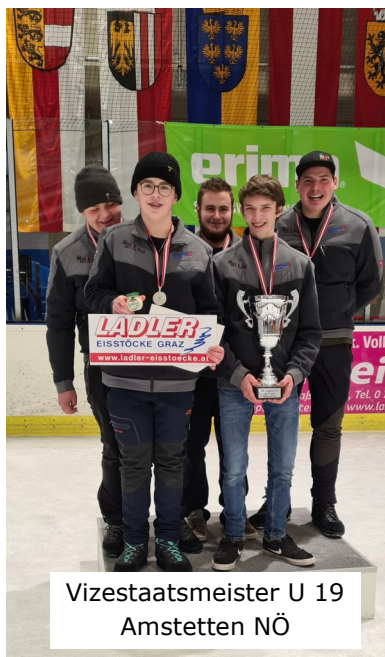
Vizestaatsmeister U 19 Amstetten NÖ

für Text und Bilder verantwort- lich: ESV Brandenburg Egon Burgstaller, Obmann