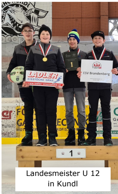
Landesmeister U 12 in Kundl

Nach einer kurzen Pause im März starten wir wieder voller Elan im April in die Sommersaison 2022 und hoffen auf ähnlich gute Leistungen. Als Vorabin- fo – es spielt die Herrenmannschaft vom ESV Brandenburg heuer in der Landesliga – wobei 3 Heimspiele stattfinden. Die Gegner mit Bad Häring, SV Breitenbach Stocksport 2 und St. Ulrich am Pillersee stehen schon fest. Die genauen Termine werden noch bekanntgegeben. Wir würden uns über viele Zuschauer und Fans natürlich sehr freuen.