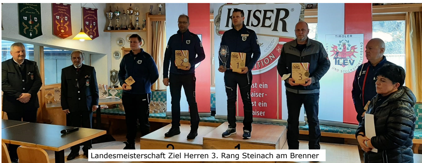
Landesmeisterschaft Ziel Herren 3. Rang Steinach am Brenner